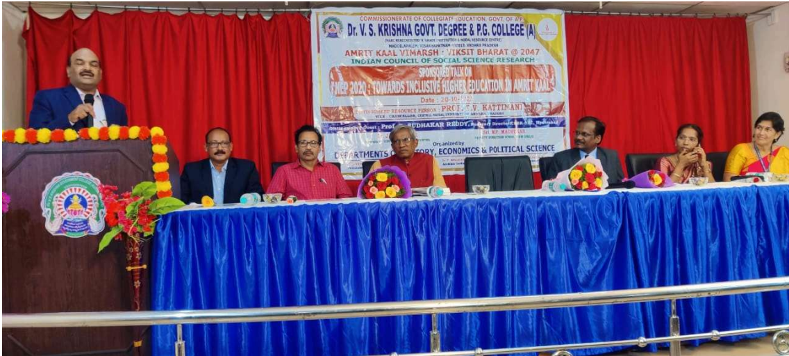
For Amrit KaalVimarsh: Viksit Bharat@2047 Lecture Series